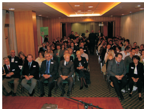
III. setkání Spinálních jednotek (9.-10. listopadu 2006)