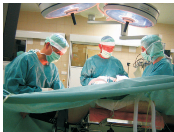
7. kongres CMCIE - přímý přenos bariatrické operace ze sálu