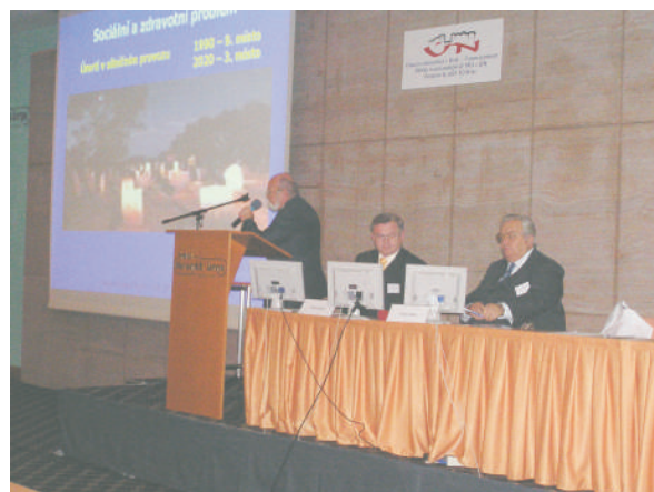
Národní kongres Dopravní úrazy (7.-8. září 2006)